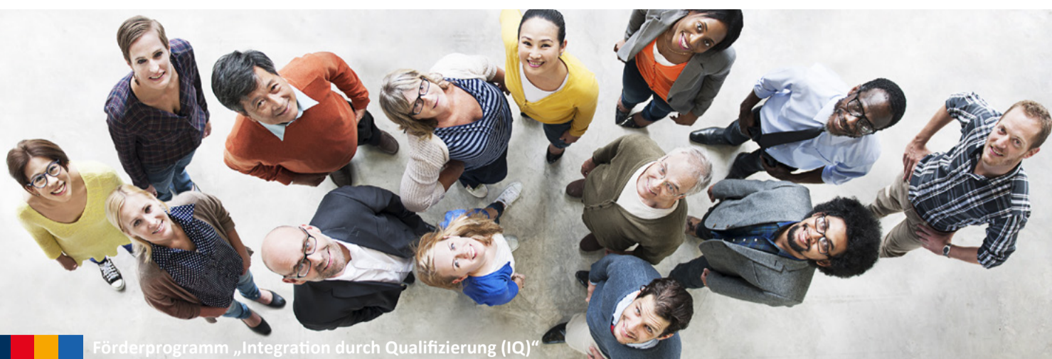
Förderprogramm „Integration durch Qualifizierung (IQ)“